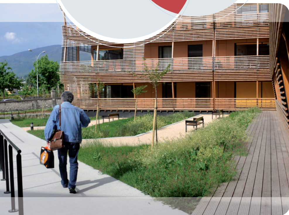
Établissement d'hébergement pour personnes âgées dépendantes "Les Terrasses de l'Horloge" à Chambéry